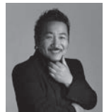
市営交通 カレンダー2019 表紙 写真家・森日出夫氏

販売場所: 地下鉄駅事務室(12駅*)、 お客様サービスセンター(横浜・上大岡)ほか ※あざみ野・センター北・センター南・横浜・横浜・関内・上大岡・上永谷・戸塚・湘南台・中山・日吉 その他の販売場所はホームページでご確認ください。カレンダーの掲載写真もご覧いただけます!