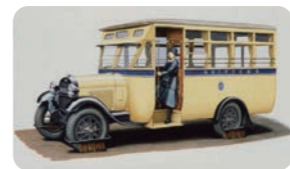
開業当時の市営バス

日時: 11月10日(土) 10:00~15:00(最終入場 14:30) ※雨天決行、荒天中止 場所: 横浜市交通局 川和車両基地(都筑区川和町379) アクセス: グリーンライン「川和町駅」 徒歩10分