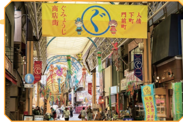
1956年に建てられた全長270mのアーケードは、当時「東洋一長いアーケード」と称されました。2001年に全長312mに改装され、今にいたります。

もともと「弘明寺観音」の門前町として栄えた商店街なので、代々続いている老舗が多いことが特徴です。商店街組合には約120のお店が加盟しており、毎月理事会を開催しているので横のつながりは強いですね。商店街では、季節ごとに「桜祭り」や「七夕」、「ハロウィン」や「クリスマスイルミネーション」など、さまざまなイベントに取り組んでいます。この良いところは、顔の見える関係があるので、コミュニティがセキュリティとして機能しているところです。お子様連れも高齢者も、安心して訪れることができる商店街を目指しています。